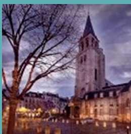
Eglise Saint-Germain des Prés