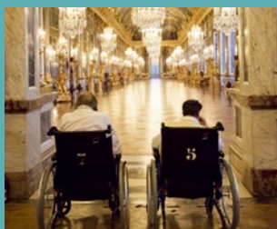
PERSONA TRÈS GRATA

Cette année la Fondation Obélisque célèbre ses 10 ans , 10 ans au cœur de la philanthropie, 10 ans d'actions au service de projets qui sont aussi les vôtres. En une décennie, elle a attribué 2,2 millions d'euros, parrainé 60 organismes ou institutions et contribué à la réalisation de plus de 160 projets.